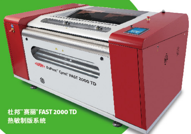
杜邦™赛丽® FAST 2000 TD 热敏制版系统